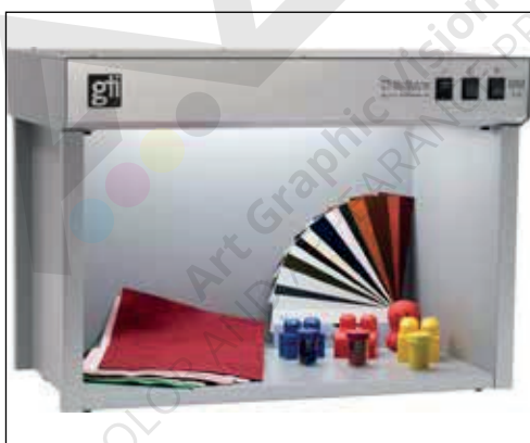
Cabina de múltiples fuentes de luz para la inspección de tintas, pinturas, plásticos, textiles, papeles, colorantes y otros materiales de color