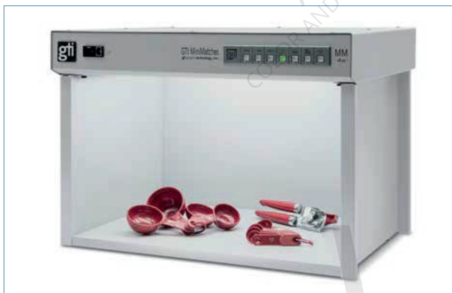
MM-2460e con cinco fuentes de luz e interruptores de botón pulsador