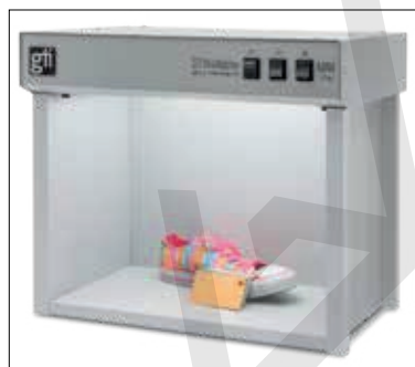
MM-2e con tres fuentes de luz e interruptores de palanca

Los MiniMatcher permiten que se evalúa y comunique color con confianza. Se usan para la revisión de tintas, recubrimientos, textiles, embalaje, cosméticos y demás productos. Cumplen con las normas industriales e incluyen un certificado de conformidad rastreado a NIST.