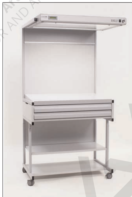
EVS-2540 con estante ajustable y dos cajones archivadores

Las estaciones EVS-2540 se ofrecen con varios accesorios opcionales: estante ajustable; paredes laterales que permiten una revisión más certera del color; cajones para archivos planos de almacenaje de materiales gráficos, hojas impresas y pruebas a color; gabinete de almacenaje solo o combinado con cajones; aditamento para elevar la estación.