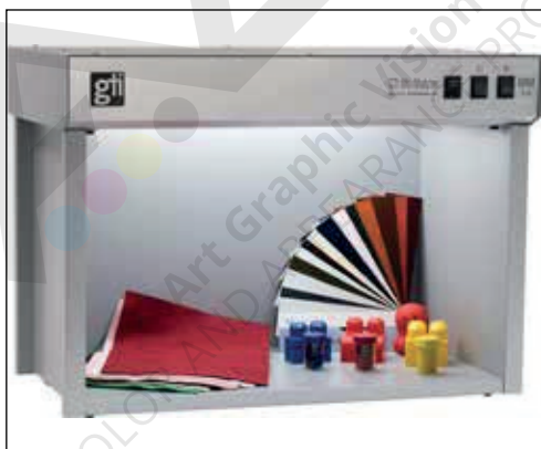
Cabina de múltiples fuentes de luz para la inspección de tintas, pinturas, plásticos, textiles, papeles, colorantes y otros materiales de color