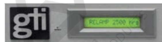
Monitor de uso de cada fuente de luz ColorGuard