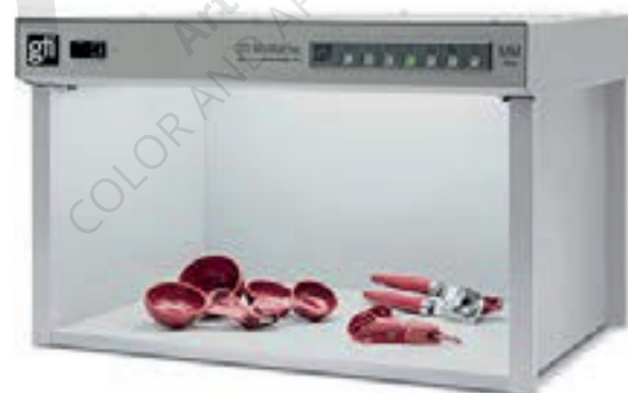
El MM-2436e es de formato semejante y un reemplazo ideal para las cabinas SpectraLight